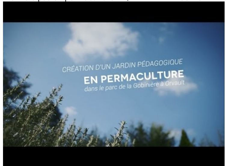
[11] Jardin pédagogique en permaculture à Orvault