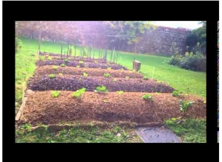
[9] Permaculture : création et évolution d'une butte autofertile