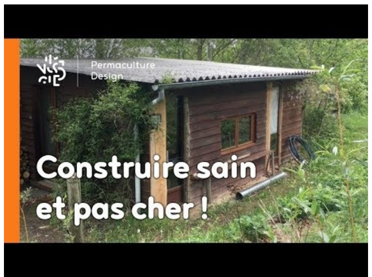
[4] La minute permaculture #9 : 3 PRINCIPES POUR CONSTRUIRE SAIN ET PAS CHER