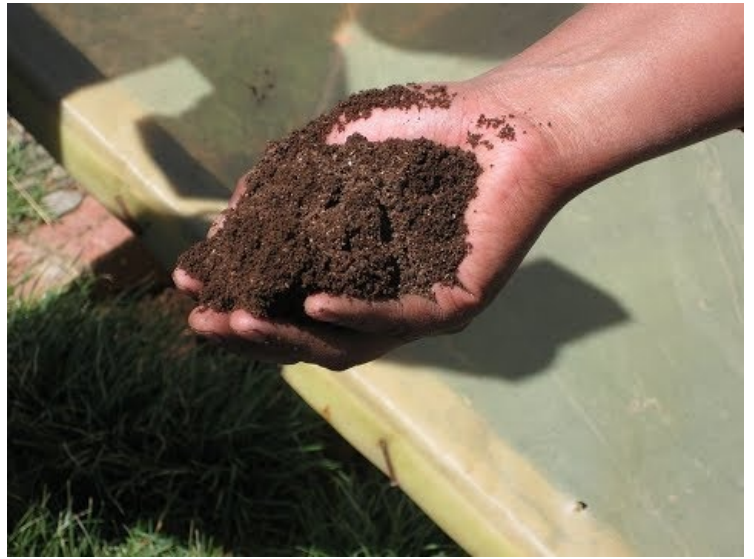
[5] Comment faire le meilleur compost ?