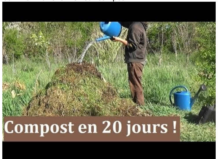
[6] Comment faire un compost en 20 jours !