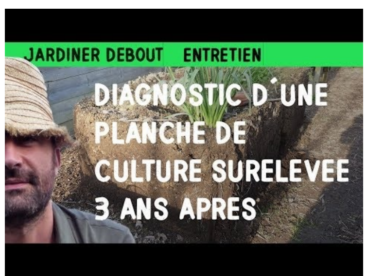
[7] Diagnostic d'une planche de culture surélevée 3 ans après