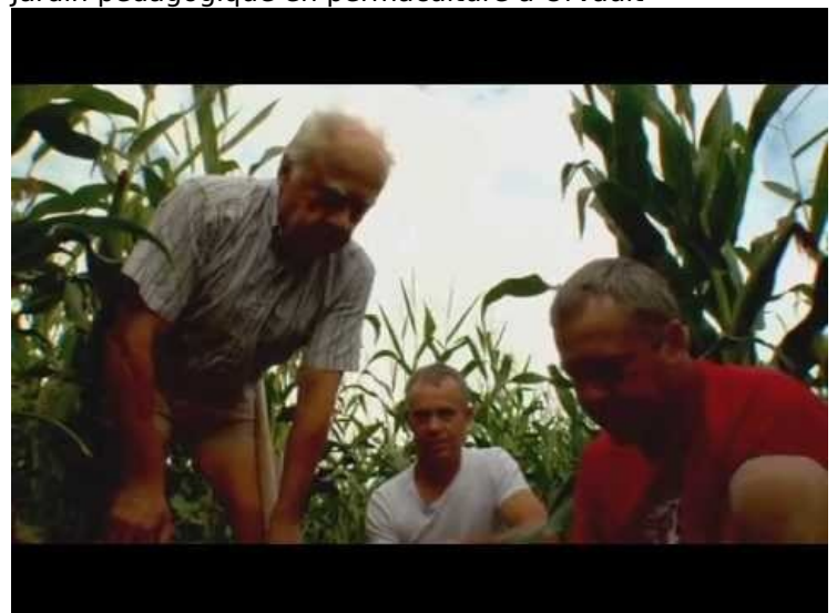
[12] La Révolution Des Sols Vivants