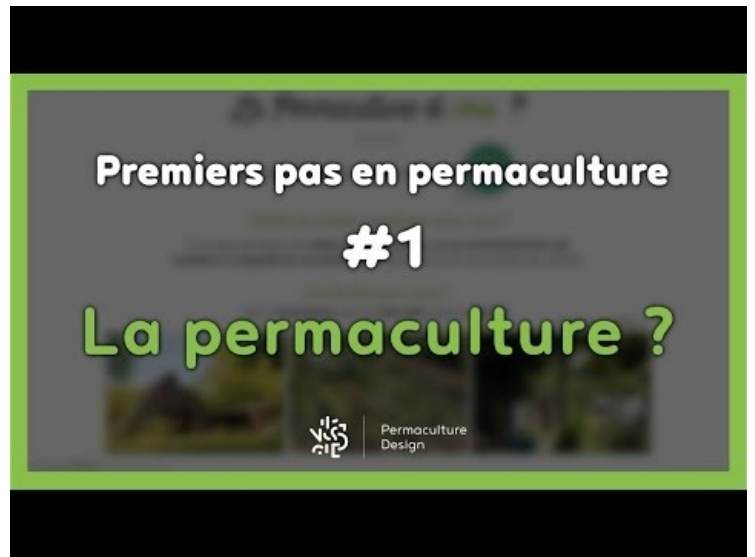
[10] Premiers pas en permaculture #1/7 - LA PERMACULTURE ?