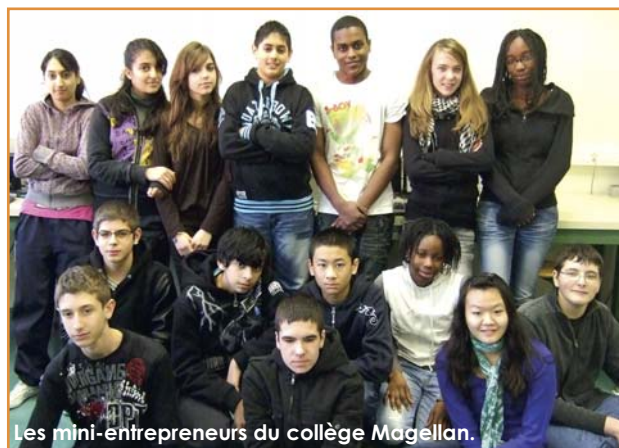
Les mini-entrepreneurs du collège Magellan.

Pour concrétiser leur futur projet, les élèves doivent constituer un capital leur permettant de couvrir les frais de production de leur produit. Pour cela, ils vont vendre des actions représentant les parts du capital de leur entreprise.