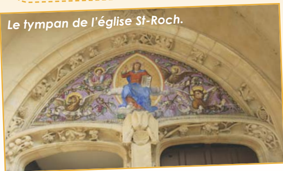
Le tympan de l'église St-Roch.

Visites commentées : du quartier de la Noé, du village historique et du coteau. Exposition sur la course "Polymultipliée" dans la salle du Conseil Municipal. (Programme détaillé voir page 5).