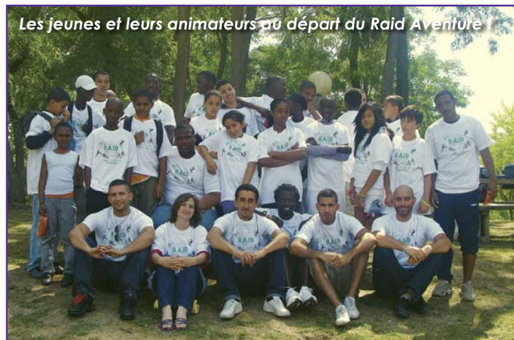
Les jeunes et leurs animateurs au départ du Raid Aventure

Point d'orgue avec le raid aventure, qui a réuni plusieurs équipes mixtes autour d'épreuves variées : VTT, kayak, escalade, tir à l'arc, course d'orientation.