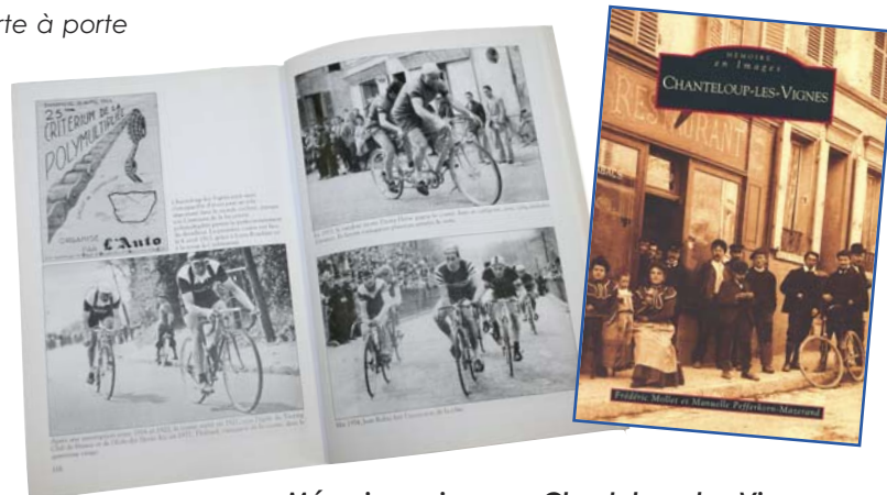
Mémoire en images, Chanteloup-les-Vignes.

« Chanteloup-les-Vignes est une ville qui vaut la peine qu'on s'y arrête car elle a un passé intéressant. »