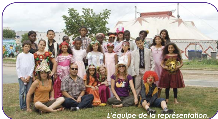
L'équipe de la représentation.

Preuve que le travail de la Compagnie des Contraires fait figure d'exemple.