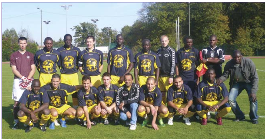
L'équipe première de l'USCV qui évolue cette année en DHR.