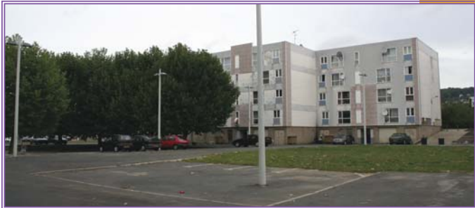
Une réunion publique de présentation du projet d'aménagement sera organisée le jeudi 12 novembre, à 18h30 à la salle des fêtes du complexe socio-culturel Paul-Gauguin.

La première phase de travaux qui s'engagera en décembre prochain consistera à reprendre l'ensemble des escaliers qui mènent de la résidence Cour Toujours à la rue de l'Échauguette.