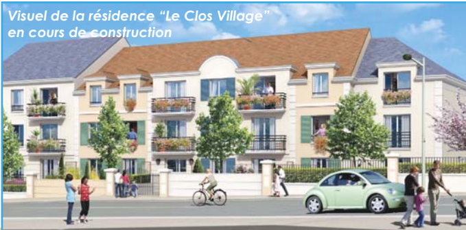
Visuel de la résidence "Le Clos Village" en cours de construction

Ces deux projets illustrent la volonté de la ville d'augmenter et de diversifier l'offre de logements avec des programmes à taille humaine, bien intégrés à leur environnement.