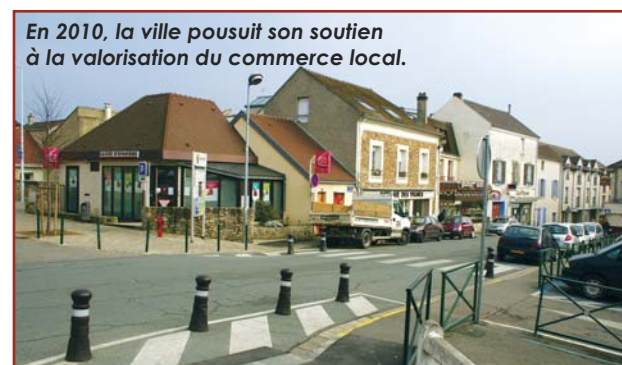
En 2010, la ville poursuit son soutien à la valorisation du commerce local.

Afin de valoriser leur rôle en matière de lien social et de leur permettre un meilleur fonctionnement, la Ville a engagé les travaux d'aménagement d'une maison des associations place du Pas, qui devrait ouvrir ses portes en 2011.