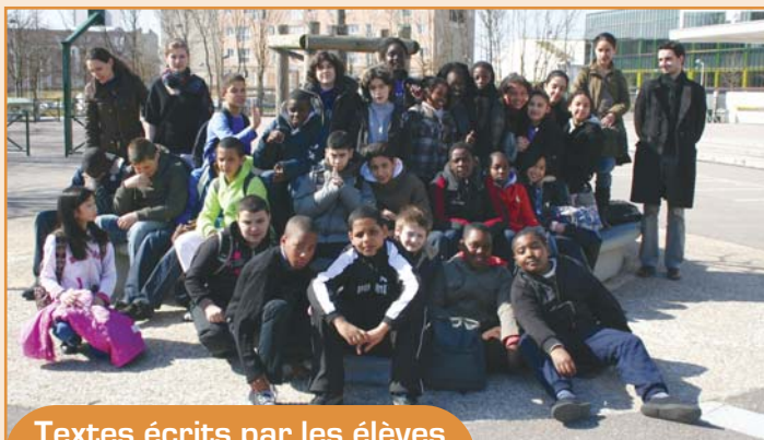
Textes écrits par les élèves