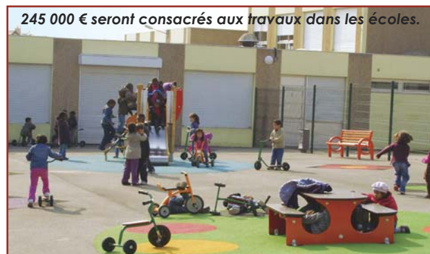
245 000 € seront consacrés aux travaux dans les écoles.

Cet outil de prévention (voir également en page 11) est aussi un véritable investissement pour l'avenir. En effet, avec la sécurité des personnes, ce dispositif permettra d'assurer la protection des espaces et équipements publics des actes de dégradation. Subventionné à hauteur de 80% par le Fonds Interministériel de Prévention de la Délinquance, la Ville a investi près de 50 000€ dans ce dispositif, qui doit permettre à terme des économies d'entretien sur les bâtiments publics.