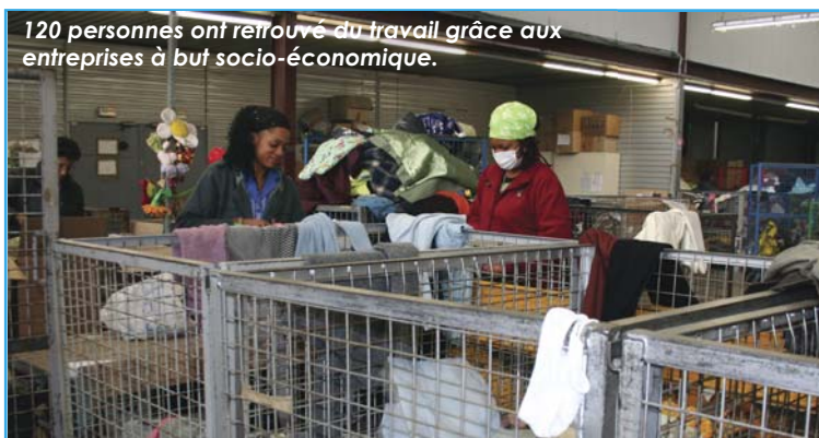
120 personnes ont retrouvé du travail grâce aux entreprises à but socio-économique.

120 personnes, dont environ 40 chantelouvais, travaillent dans les entreprises à But socio-économique Espérance et Le Relais Val de Seine , qui agissent dans les domaines de la collecte et du tri de vêtements et le conditionnement de produits cosmétiques. L'objectif de ces entreprises est la lutte contre l'exclusion par la création d'emplois pour les personnes en difficulté.