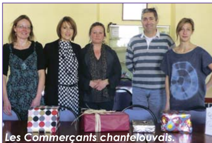
Les Commerçants chantelouvais.