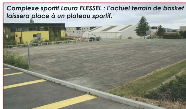
Complexe sportif Laura FLESSEL : l'actuel terrain de basket laissera place à un plateau sportif.

Équilibré et réaliste, le budget 2010 combine des investissements majeurs pour la poursuite de la transformation de la Ville (voir ci-dessous) tout en maintenant l'exigence d'un service public de qualité, comme l'illustre par exemple l'attention portée à l'action sociale et la hausse de la subvention au Centre Communal d'Action Sociale (417 018€).