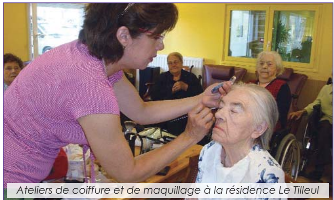
Ateliers de coiffure et de maquillage à la résidence Le Tilleul

Après avoir reçu parents et enfants sous le chapiteau, les coiffeurs sont allés à la rencontre du public, avant de se rendre à la résidence Le Tilleul où le service a été particulièrement apprécié des résidents.