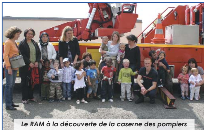
Le RAM à la découverte de la caserne des pompiers

En effet, avant la traditionnelle et très appréciée fête de la petite enfance et le pique-nique du Relais Assistantes Maternelles, les petits Chantelouvais sont partis à la découverte de la caserne de pompier de la Ville. De quoi susciter bien des vocations à la vue des camions rouges. Les soldats du feu chantelouvais en ont d'ailleurs profité pour commencer la formation des jeunes sapeurs, avec le maniement de la lance à incendie.