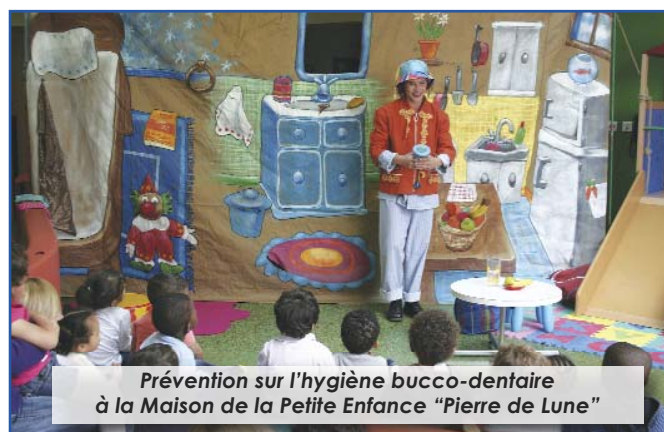
Prévention sur l'hygiène bucco-dentaire à la Maison de la Petite Enfance "Pierre de Lune"

Par ailleurs, les services de la Petite Enfance, avec le Centre de Protection Maternelle et Infantile, ont mené le 18 mai une action de prévention sur la santé bucco-dentaire, au sein de la Maison de la petite enfance Pierre de Lune.