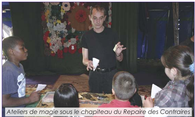
Ateliers de magie sous le chapiteau du Repaire des Contraires