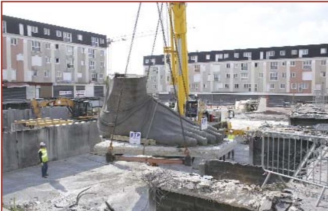
Image insolite et symbolique du Grand Projet de Ville le 4 mai dernier.

Dans le cadre du chantier de réaménagement de la place du Pas, la sculpture du pied, emblématique du quartier, a été déplacée à proximité de la halle du marché.