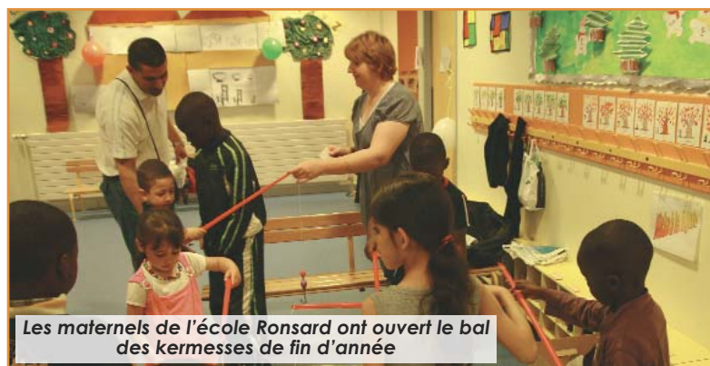
Les maternelles de l'école Ronsard ont ouvert le bal des kermesses de fin d'année

Chez les maternelles, l'école Ronsard a ouvert le bal des fêtes de fin d'année organisées dans les groupes scolaires de la Ville.